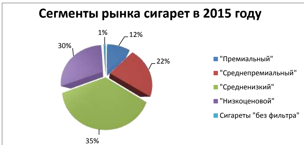
Рис. 2. Сегменты рынка сигарет в 2015 г.

В настоящее время табачный рынок РФ представлен широким спектром табачных изделий от сигарет «без фильтра» до элитных сигарет с фильтром. Спрос покупателей на «премиальные» сигареты упал на 0,5%, на «среднепремиальные» упал на 0,3%, а на «средненизкий» повысился на 1% и на «низкоценовой» повысился на 0,1%. Это говорит о том, что потребители из-за повышения цен на табачные изделия переходят от более дорогих марок сигарет к более дешевым.