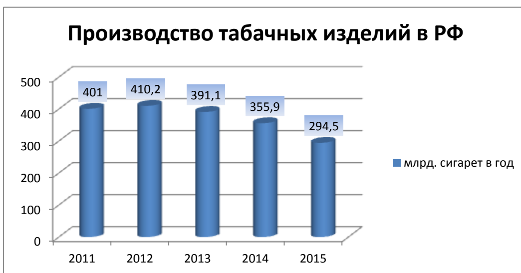
Рис. 3. Производство табачных изделий в РФ (2011-2015 гг.)

На сегодняшний день рынок табачной продукции крайне неустойчив. В связи с принятым «антитабачным» законом «Об охране здоровья граждан от воздействия окружающего табачного дыма и последствий потребления табака», вступившим в силу с 1 июня 2014 года, число курящих россиян снизилось на 17% и рынок табачной продукции сократился до 355,9 млрд сигарет в 2014 году [5,6].