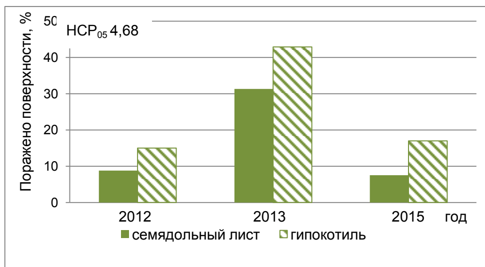
Рис. 1. Средний % поражённой поверхности семядольных листьев и гипокотилей 10-дневных проростков подсолнечника через 2 суток совместного культивирования с культурами изолятов Ph. Macdonaldii

Для сравнения агрессивности изолятов Ph. macdonaldii разных лет сбора определяли средний по 4 генотипам подсолнечника процент поражённой поверхности отчленённых семядольных листьев и гипокотилей 10-дневных проростков подсолнечника через 2 суток пребывания в контакте с колониями гриба.